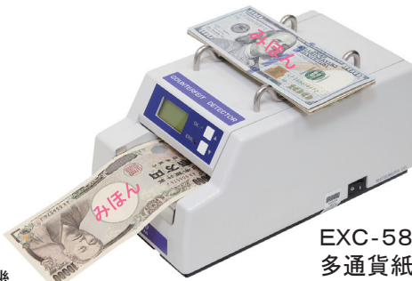
EXC-5800 多通貨紙幣鑑別機