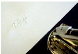
(例)用紙の下側を選択した場合