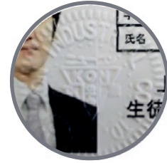
割印部のイメージ図