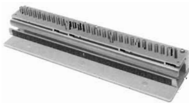
● 丸穴 JIS30・26穴用パンチブロック