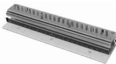
● コンピュータ22穴用パンチブロック