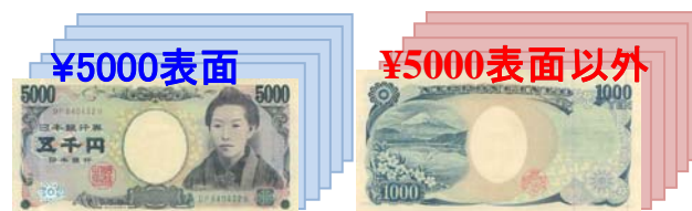
(例) 1枚目が表面 ¥5000のとき

1枚目と同金種・同面(裏or表)を計数し、枚数・合計金額を表示(スタッカー下段へ)。他はリジェクト枚数を表示(スタッカー上段へ)。