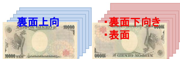
(例) 1枚目が表面上向きのとき

1枚目の同面同方向(上or下)を計数し、枚数・合計金額を表示(スタッカー下段へ)。他はリジェクト枚数を表示(スタッカー上段へ)。