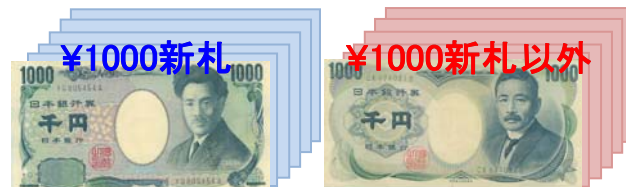
(例) 1枚目が¥1000新札のとき

1枚目と同金種・同様の新券または旧券を計数し、枚数・合計金額を表示(スタッカー下段へ)。他はリジェクト枚数を表示(スタッカー上段へ)。