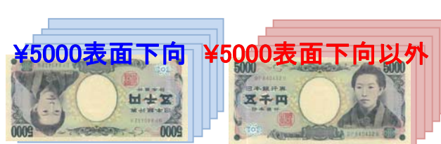
(例) 1枚目が¥5000表面下向きのとき

1枚目の同金種・同面同方向(上or下)を計数し、枚数・合計金額を表示(スタッカー下段へ)。他はリジェクト枚数を表示(スタッカー上段へ)。