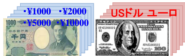
(例) 日本円を選択したとき

通貨種類「円」を例としています。 USドル・ユーロ (BN-624B・BN-624C) の識別処理機能は、「円」と同じです。