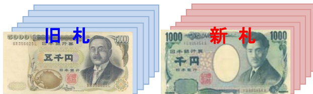
(例) 1枚目が旧札のとき

1枚目と同様の新券または旧券を計数し、枚数・合計金額を表示(スタッカー下段へ)。他はリジェクト枚数を表示(スタッカー上段へ)。