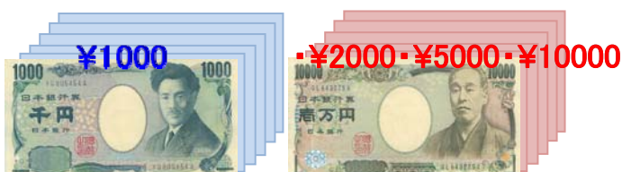
(例) ¥1000を選択したとき

選択した金種を計数し、枚数・合計金額を表示 (スタッカー下段へ)。 他はリジェクト枚数を表示 (スタッカー上段へ)。