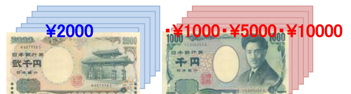
(例) 1枚目が ¥2000 のとき

1枚目と同金種を計数し、枚数・合計金額を表示 (スタッカー下段へ)。 他はリジェクト枚数を表示 (スタッカー上段へ)。