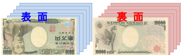
(例) 1枚目が表面のとき

1枚目と同面(裏or表)を計数し、枚数・合計金額を表示(スタッカー下段へ)。他はリジェクト枚数を表示(スタッカー上段へ)。